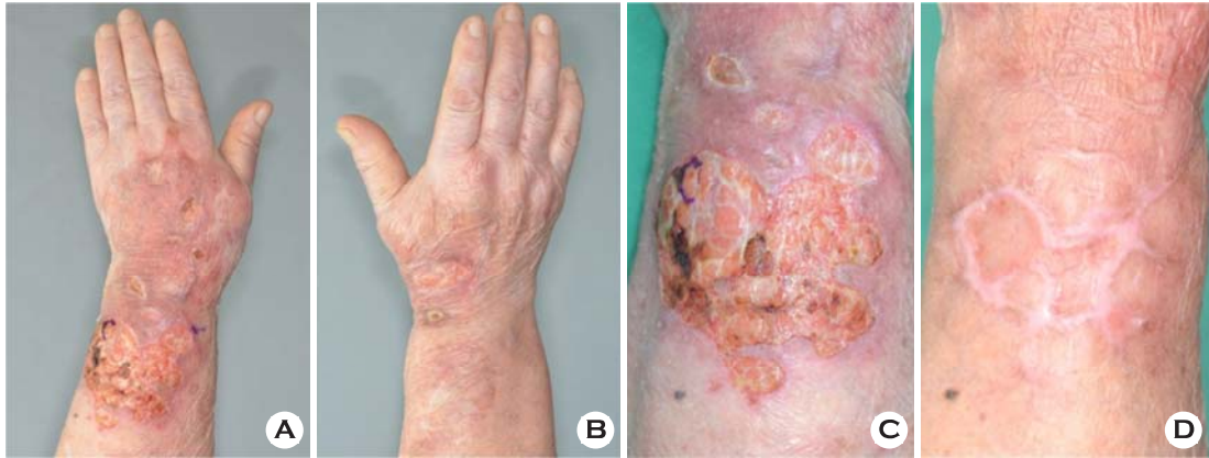
Fig. 1. (A, B) Ill-defined edematous and erythematous patches with various sized and shaped deep ulcers on both dorsal hands and left distal forearm. (C) Close up view of the lesion on the left forearm. (D) Marked improvement of skin lesion 5 weeks after treatment.